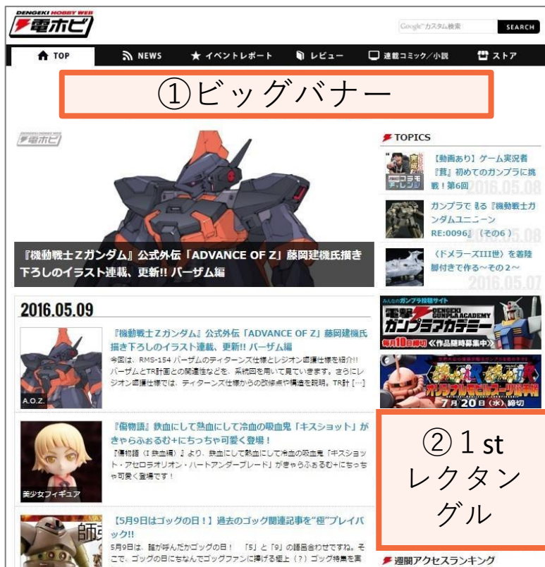
(PCトップページイメージ図)